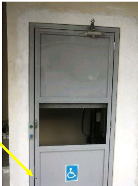
Furo na porta para enfiar a chave de fenda e abrir a porta